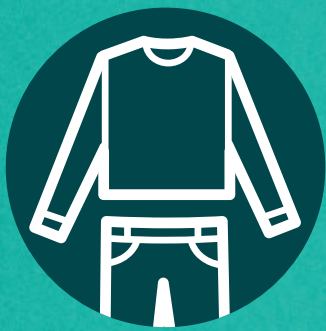
Vêtements amples et couvrants

Protégez-vous en adoptant les bons gestes pour éviter de vous faire piquer