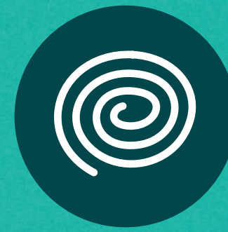
Serpentins à l'extérieur