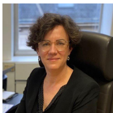
Virginie Cayré, directeur général de l'ARS Grand Est

Les conclusions des conférences citoyennes régionales de 2019, organisées dans le cadre du grand débat national, ont souligné l'attachement des Français aux services publics de proximité. L'amélioration de l'accès à la santé apparaît comme la priorité pour plus de 30 % des participants à ces discussions territoriales.