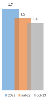
Seuil maximal gramme de sel pour 100g de pain courant