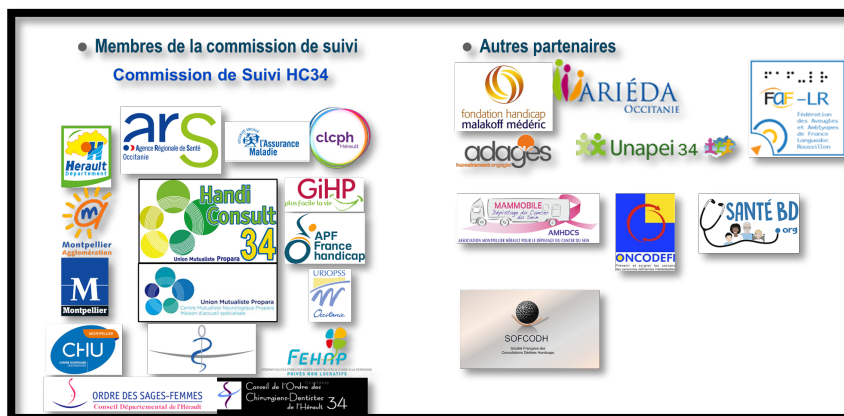
Ensemble des partenariats institutionnels ou fonctionnels de HandiConsult34

La plupart de ces partenariats préexistait dans le cadre de l'activité du CMNP (SSR) et de la Maison d'Accueil Médicalisée, la création de HandiConsult34 a permis de les renforcer et de les formaliser dans le cadre d'une instance de suivi partenarial. La commission de suivi se réunit deux fois par an et a un rôle d'évaluation (reporting par étape) et d'orientation du déploiement du dispositif, ainsi que de mise en lien avec les acteurs et interlocuteurs locaux ou régionaux en lien avec l'activité de l'unité.